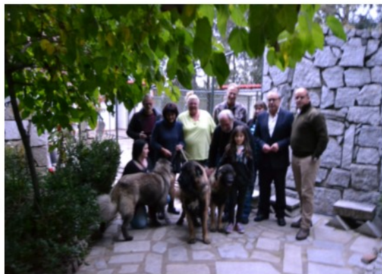
Canil Cabeço do Seixo