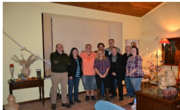
Canil Vale do Juiz

Swedish club visit to Portugal 2016 The Swedish Estrela club's breed council and some of our members went to Portugal in November 2016. Since the breed is in dire need of new dogs and new blood in Sweden, the primary reason for our trip was to re-connect with old and make new acquaintances in Portugal to best offer and assist our members as needed. Monografica 2016 was organized by Licrase. The breeding council had the great pleasure of being invited and Licrase had arranged an exemplary schedule for us not only to visit the Monografica but also