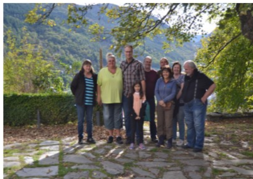
Canil da Quinta de São Fernando