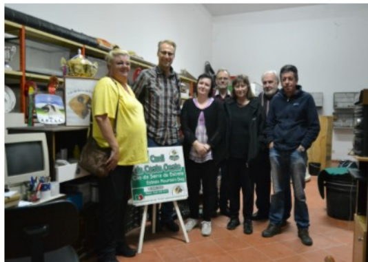
Canil Da Costa Oeste

agradecimento a todos os nossos associados que abriram as portas de suas casas e canis e que forma tão amigável e prestável nos receberam tornando toda esta experiência uma verdadeira festa do Cão da Serra da Estrela. Um especial agradecimento ao muito efusivo grupo de criadores Suecos que tivemos o prazer de acompanhar e de partilhar esta viagem magnífica. Aqui serão sempre bem vindos.