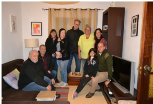
Canil Quinta da Liria

Deixamos aqui fotos de grupo aos canis que foram visitados desta vez. Para ver as fotos de toda a visita dirijam-se ao nosso facebook.