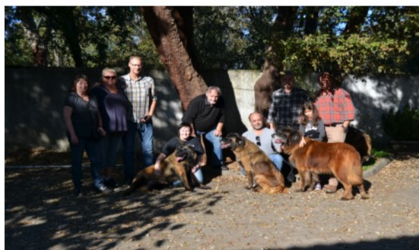
Canil Terras D'Cister

several kennel visits. Unfortunately, The Monografica had to be moved but since we had already booked our trips, still had the opportunity to interpreter etc. and, of course, another day for even more kennel visits, we decided to go anyway. We had four fantastic and very hectic days in Portugal! For obvious reasons we simply could not reach to visit everyone, but this was a start for what we hope are many more trips and possible kennel visits to come! This time we reached to visit with nine kennels, some smaller breeders with fewer dogs and some really big kennels with upwards of 20 some dogs. The quality of dogs, of course, varied also in Por-