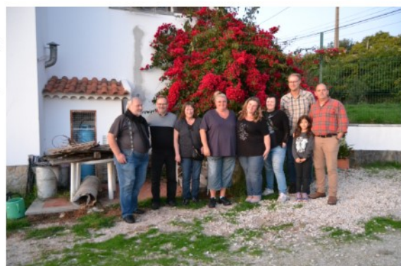
Canil Quinta do Ganhão

tugal, but we saw many excellent dogs that we hope to be able to take part of in the future. To my knowledge this is the first time that any Portuguese club has invited other countries' clubs to visit Portugal in organized forms to get better cooperation for our breed across national borders. The importance of cooperation can truly never be emphasized enough, and it is vital in such a small breed! Something that the SCSE club has as a motto; "With experience you'll come a long way, but with cooperation you will come even further!" It was a very hectic schedule since our time was short and limited, but Licrase had done an exemplary preliminary work and with the help of our