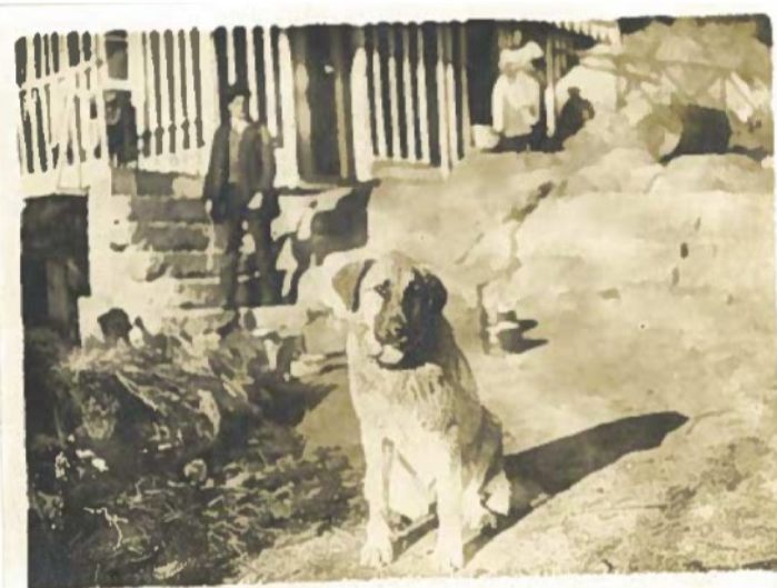
Leoa ainda cachorra

O amigo do meu Avô ao vê-la diz, “dou-lhe já 150 escudos por ela”, ao que o Pastor responde, “ou é para o Dr. Afonso Costa ou volta comigo para casa”.