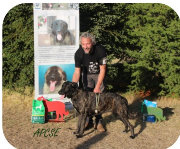
Classe de Campeãs - Fêmeas