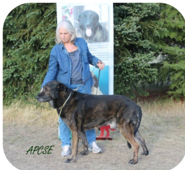
Classe de Veteranos- Machos