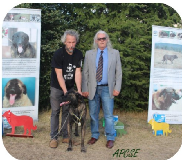
Classe de Campeões - Machos