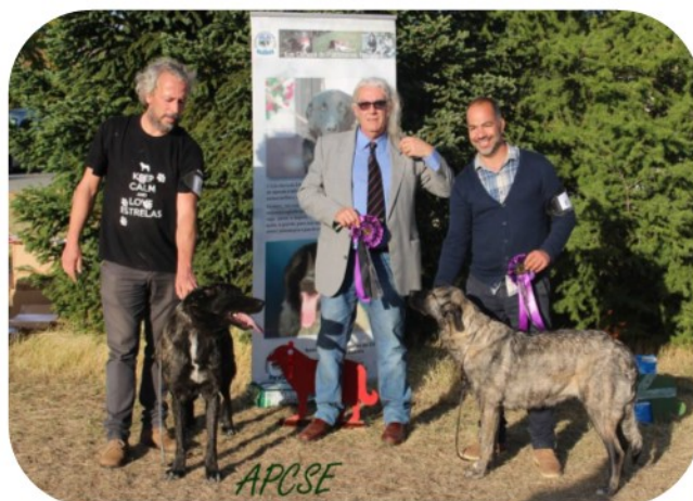
Melhor Fêmea de Pêlo Curto