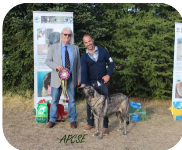
Classe Intermedia - Fêmeas