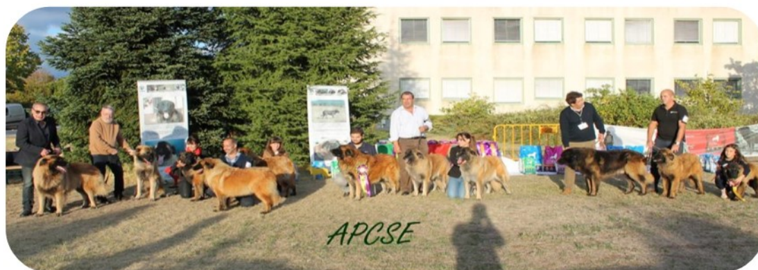
Melhor Grupo de Criador

1º N'Beirão do Cabeço do Seixo e A'Tanira do Cabeço do Seixo 2º Salvador D'Alpetratina e Salva D'Alpetratina 3º Onix da Casa de Lôas e Nikita da Casa de Lôas