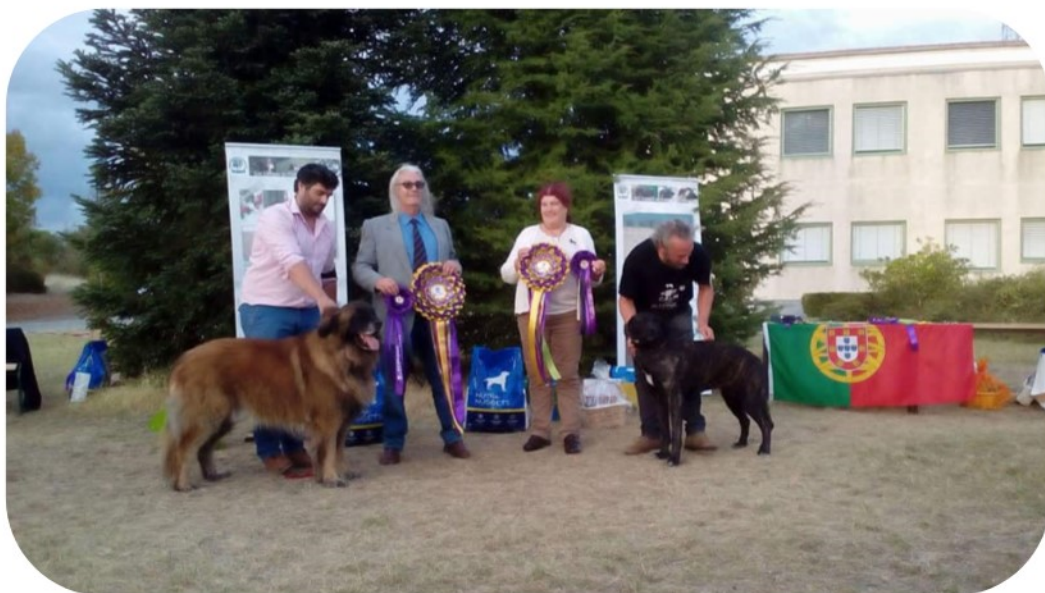
BIS - Tudor da Quinta da Liria