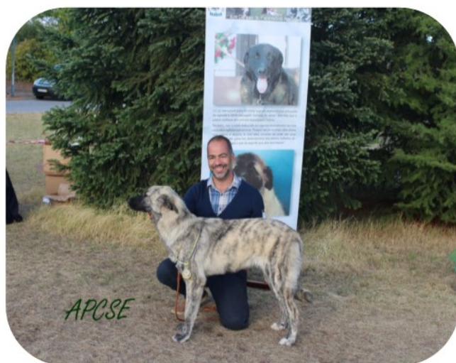
Classe de Cachorros - Fêmeas